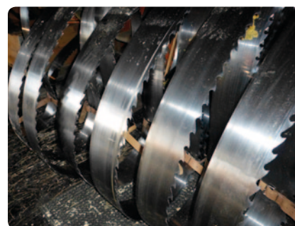
Rene blade efter 36 timers drift.