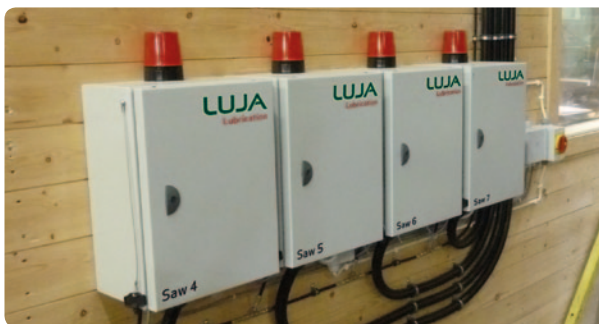
Moduler for sav