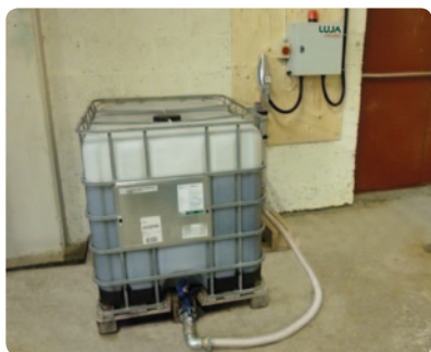
Startmodul med pumpe og IBC-palletank

For at opnå den mest stabile oliedosering kan din virksomhed benytte sig af Lujas automatiske eller manuelle oliedoseringsanlæg. Kombineret med Luja Bio-Oil og vores smøre/skrabesystem giver det den bedste smøring af båndsave, som findes på markedet.